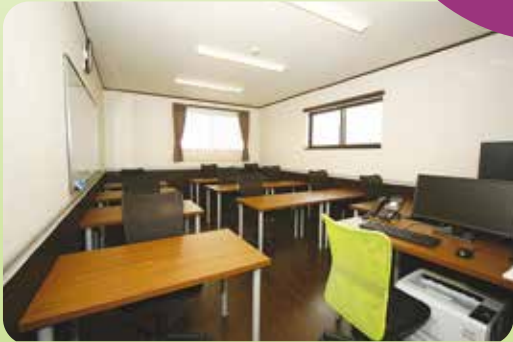
新築だから教室もキレイ♡